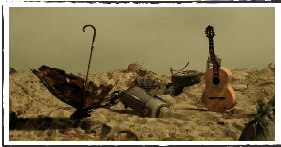
LES ANGES DÉCHETS Pierre M. Trudeau 2008, 5 min 30 s

Un documentaire animalier sans animaux qui célèbre la beauté de la nature dans un dépotoir.