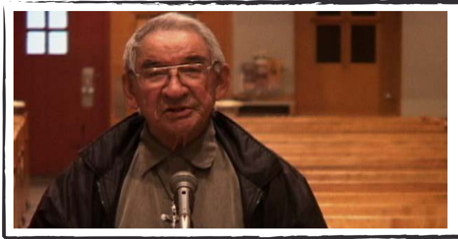
CHIFFRE James Picard 2009, 3 min